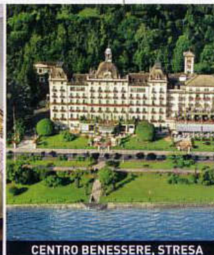
CENTRO BENESSERE, STRESA