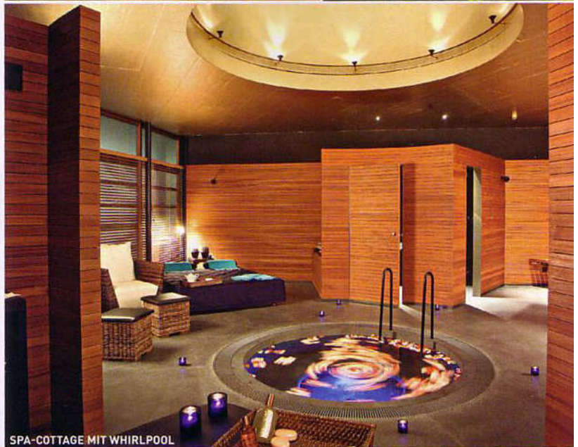
SPA-COTTAGE MIT WHIRLPOOL