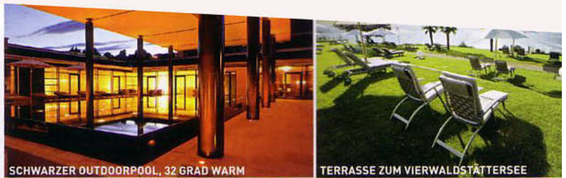
SCHWARZER OUTDOORPOOL, 32 GRAD WARM