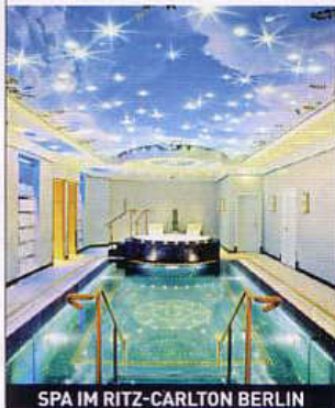
SPA IM RITZ-CARLTON BERLIN

10 GRAND HOTEL RESIDENCIA, GRAN CANARIA Im Spa des Luxusresorts wird die Haut mit Kalllasern und Hyaluronsäure ohne Injektionen geglättet. Preis: inklusive Reinigung und Maske 198 Euro. DZ ab 300 Euro. Zu buchen über Gold by FTI, Tel. 089/25251099, www.goldbyfti.de